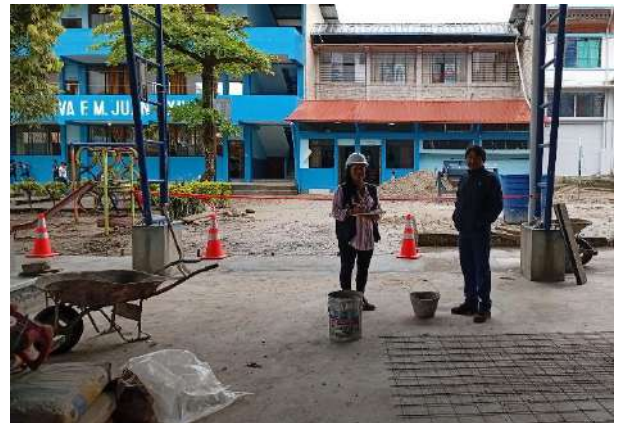
DOS SAÑALES DE PREVENTIVAS – ROTULOS INFORMATIVOS 60*60 cm Y CUATRO SEÑALES PORTATILES (CONOS)