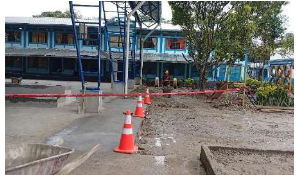
SEÑALES PORTATILES (CONOS)