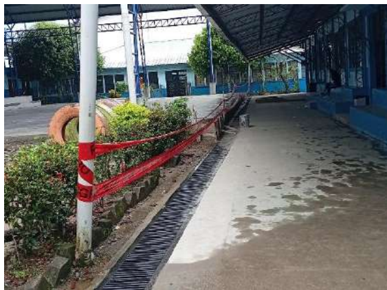
CINTAS PLATICAS DEMARCACION DE AREAS DE TRABAJO Y SEÑALES PORTATILES (CONOS)