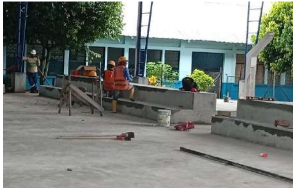
AVANCE DE OBRA